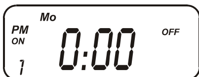
Fig. 5 – Aparência do display ao se entrar pela primeira vez no modo de programação. Neste exemplo a programação ficaria válida apenas para a segunda-feira.

O número 1 no canto inferior esquerdo do display indica que estamos no primeiro programa de um total de doze e o símbolo ON indica que é o horário de ligar.