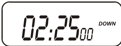
Fig. 2 – Exemplo de contagem regressiva programada para duas horas e vinte e cinco minutos.