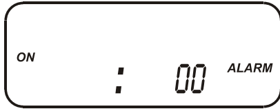
Fig. 3 – Programação do número de segundos de duração do modo alarme.