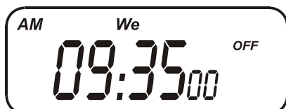
Fig. 1 – Exemplo de ajuste em nove horas e trinta e cinco minutos da manhã de quarta-feira.